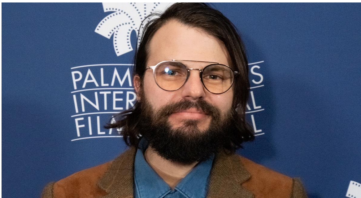
Regisseur und Drehbuchautor Colin West

Damit wurde die Aufgabe klar und die Methodik für die Ausarbeitung dieser Geschichte offenbarte sich - der Film sollte in einem bestimmten Ton und nicht in einer bestimmten Zeit spielen. Es sollte ein Prozess der Entdeckung und Erkundung sein, bei dem die emotionale Relevanz im Vordergrund steht und nicht ein klarer erzählerischer Zusammenhalt. Diese tonalen Fäden verflochten sich zu einer fantastischen Geschichte, die ein ganzes Leben bedeutender Momente einer Generation zu einer Art kosmischem Wandteppich von Lebensereignissen verwebt, wie man sich an sie erinnern könnte, anstatt wie sie in der Realität passiert sind. Und so wurde es eine einzigartige Geschichte voller magischem Realismus, situativem Humor und herzlichem Familiendrama. Und doch war alles in der Beziehung zwischen zwei Menschen, einem Mann und einer Frau, im Laufe eines Lebens verankert.